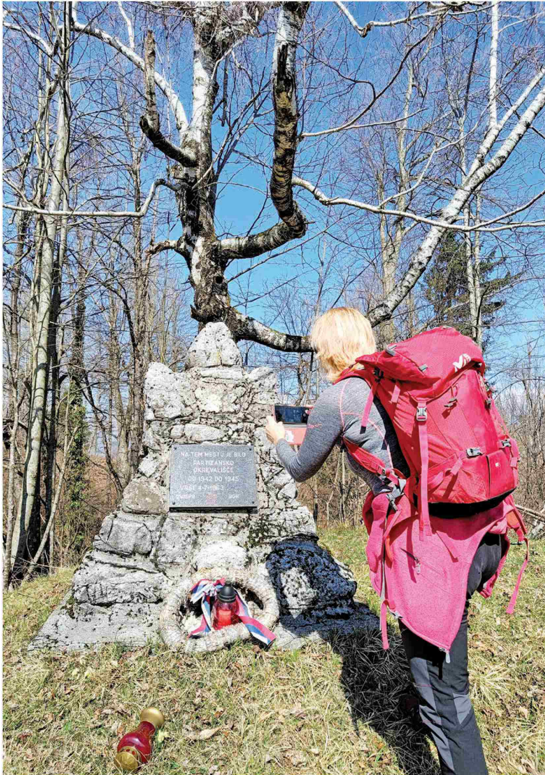
Slovenska vojaška partizanska bolnišnica Pavla, okrevališče št. 1 - Male Vrše je od začetka leta 1943 do aprila 1945 dajala zavetje in zdravljenje 457 ranjenim in obolelim borcem narodnoosvobodilnega boja Slovenije.