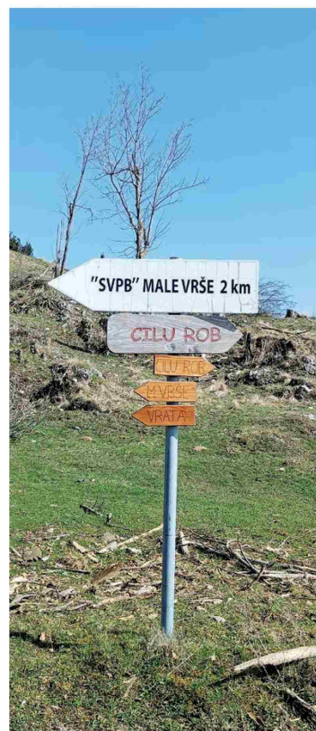
Ob poti redko vidiš markacijo, še redkeje so usmerjevalne table.