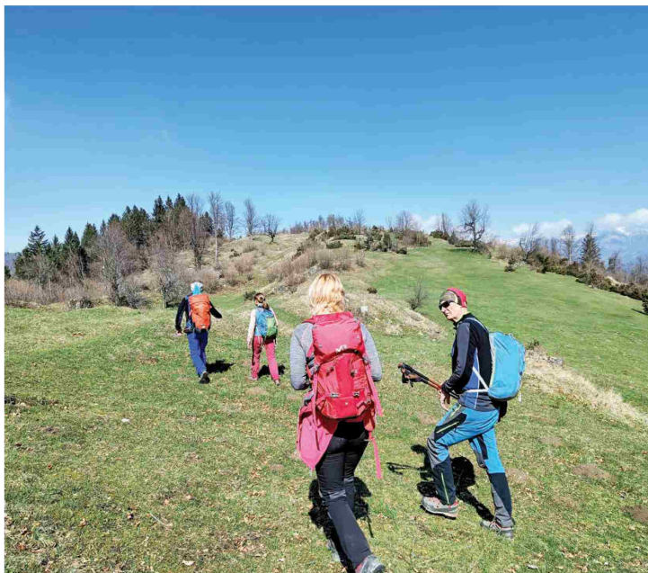
Planinska zveza Slovenije želi razbremeniti množično obiskane cilje, kot so Triglav in drugi podobni konci.